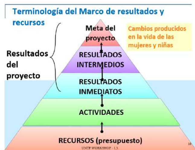
Diagrama 1. Terminología del Marco de Resultados y Recursos

El Proyecto basó sus operaciones en el financiamiento de Fondo Fiduciario de ONU Mujeres, con estos recursos se implementó las actividades de índole institucional y comunitaria, con una amplia participación de todos los sectores que juegan un papel importante en la prevención y atención de la violencia en Escuintla. Se plantearon resultados intermedios y metas para obtener los productos esperados. Ver el diagrama a continuación, donde se describe estos resultados y meta.