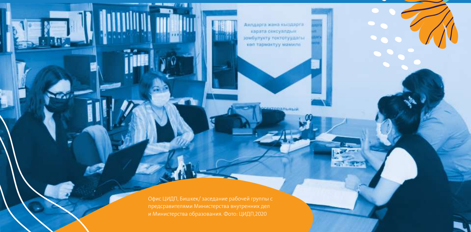
Офис ЦИДП, Бишкек/ заседание рабочей группы с представителями Министерства внутренних дел и Министерства образования.