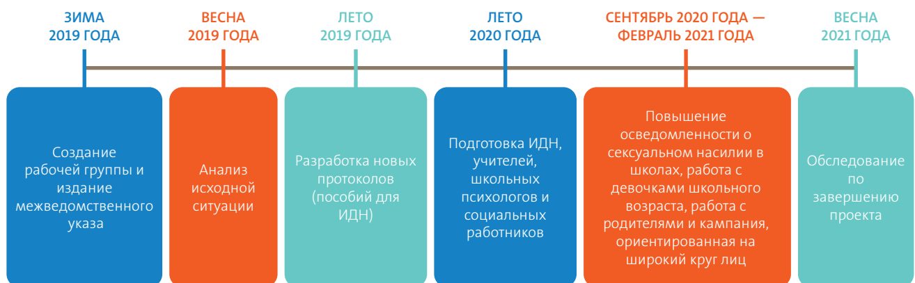
График проекта и ключевые этапы

Средняя школа 73 города Бишкека/ дискуссия ЦФ ООН с ученицами 8–11 классов, принявшими участие в базовом исследовании Фото: Целевой фонд ООН, 2019